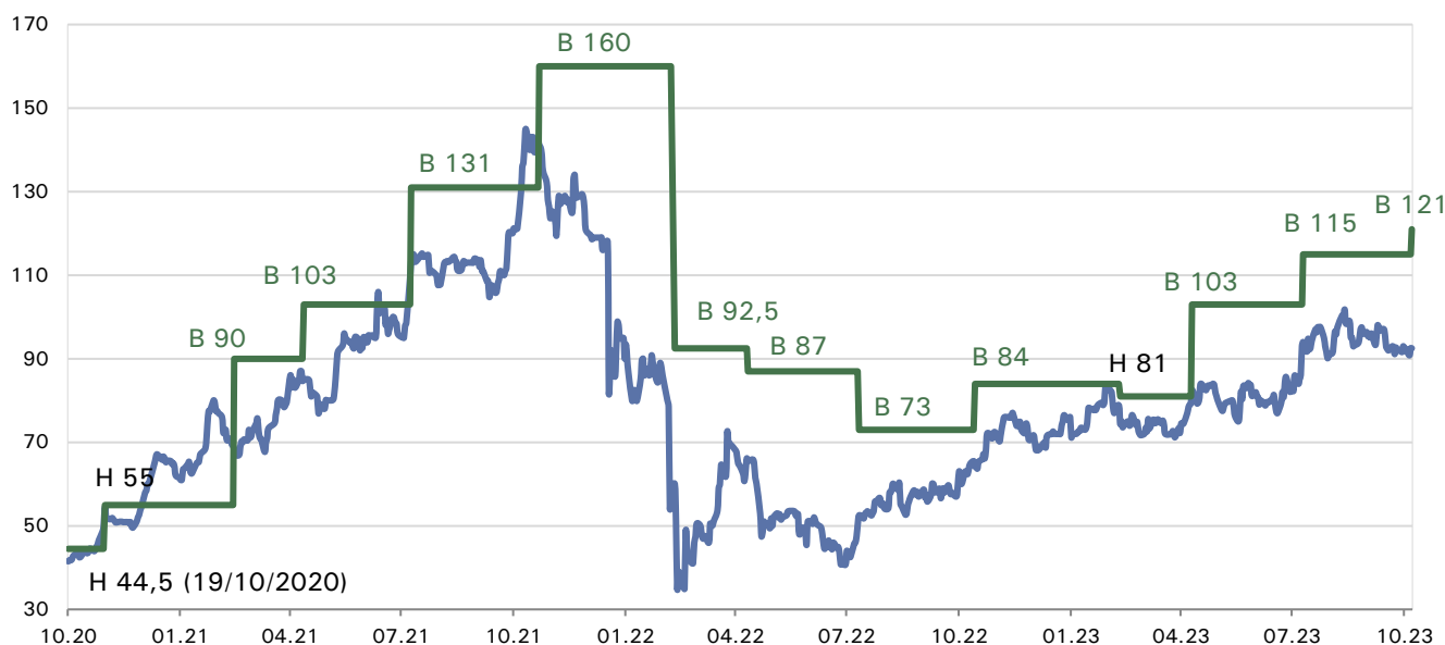
Иллюстрация 3. Процентное соотношение текущих оценок от Freedom Broker по бумагам KASE