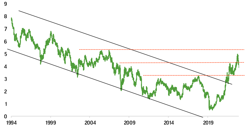
US 10Y bond yield